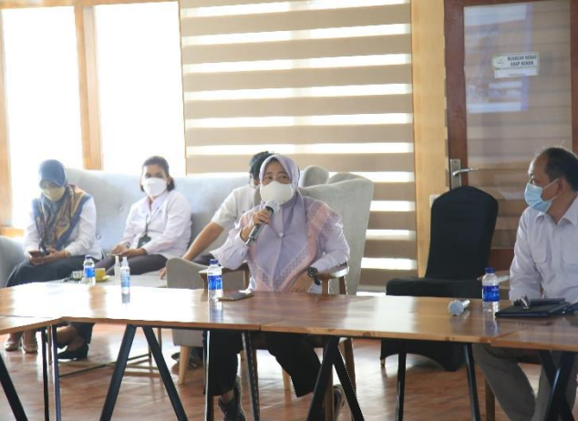
9. Kaji Banding PJT I ke PJT II tentang Sumber Daya Manusia, 07/03/2022