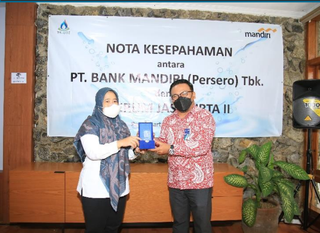
13. PJT II dan Bank Mandiri Kerjasama Layanan Perbankan, 23/03/2022