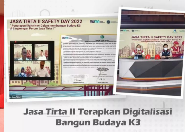
Jasa Tirta II Terapkan Digitalisasi Bangun Budaya K3