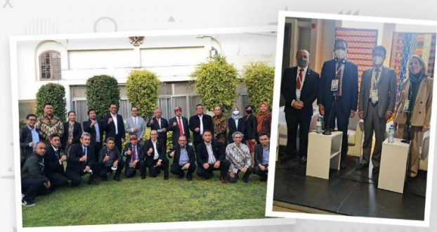
Jasa Tirta II Hadir di World Water Forum (WWF) ke-9 di Senegal