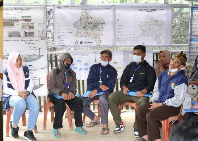
59. Pelatihan Limbah Ternak Menjadi Biogas, 30/09/2022