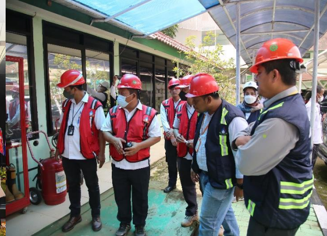
67. Sertifikasi SMK3 di Lingkungan PJT II, 16-17/11/2022