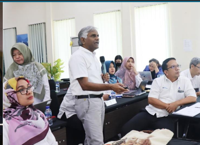
71. In House Training Pelatihan Manajemen Risiko Batch II, 22-25/11/2022