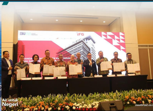
78. PJT II Berkolaborasi dengan IFG Kelola Investasi Dana Pensiun Bersama, 20/12/2022