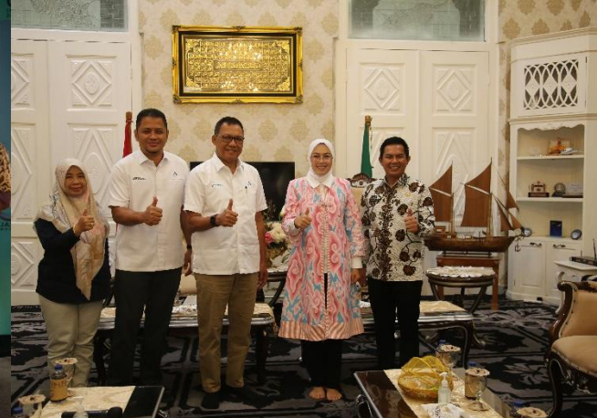
52. Kunjungan Kerja Direksi PJT II ke Kantor Bupati Purwakarta, 25/08/2022