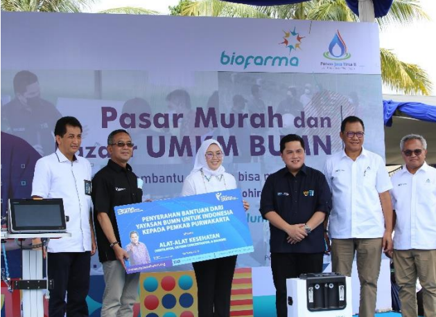
57. Pasar Murah dan Bazar UMKM BUMN di Kabupaten Purwakarta, 23/09/2022