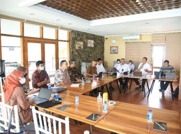
25. Kunjungan Kerja Danareksa ke PJT II, 19/05/2022