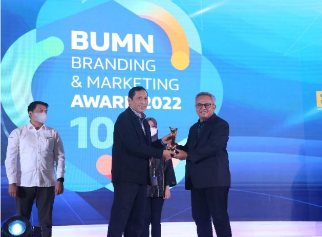
65. PJT II Raih Penghargaan BUMN Branding & Marketing Awards 2022 10th, 09/11/2022