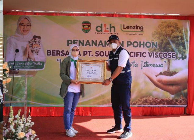
3. Penghargaan untuk PJT II atas Program Penghijauan di Lahan Kritis di Green Belt Waduk Jatiluhur, 03/02/2022