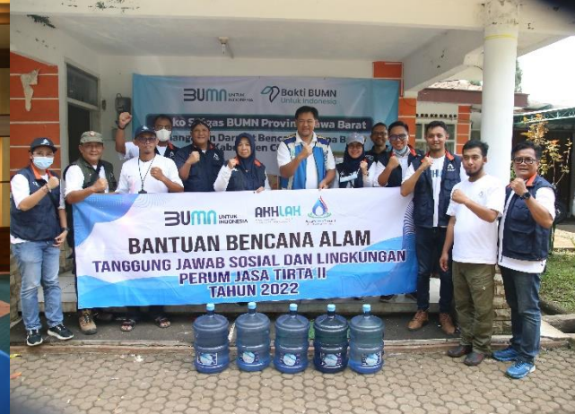
75. PJT II Salurkan Bantuan Air Bersih untuk Warga Terdampak Gempa Bumi Cianjur, 01/12/2022