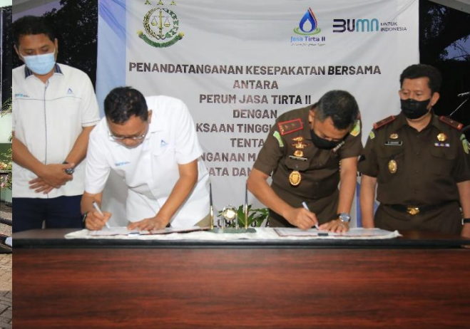
19. PJT II Berbagi, Maju dan Tumbuh Bersama, 31/03/2022