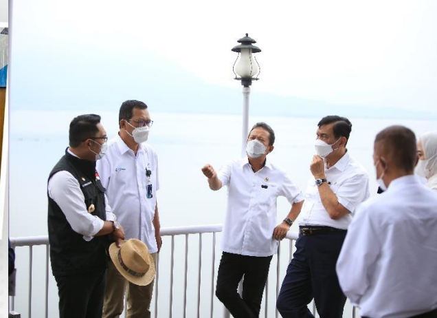
11. Kunjungan Menko Marinves ke Waduk Jatiluhur, 15/03/2022