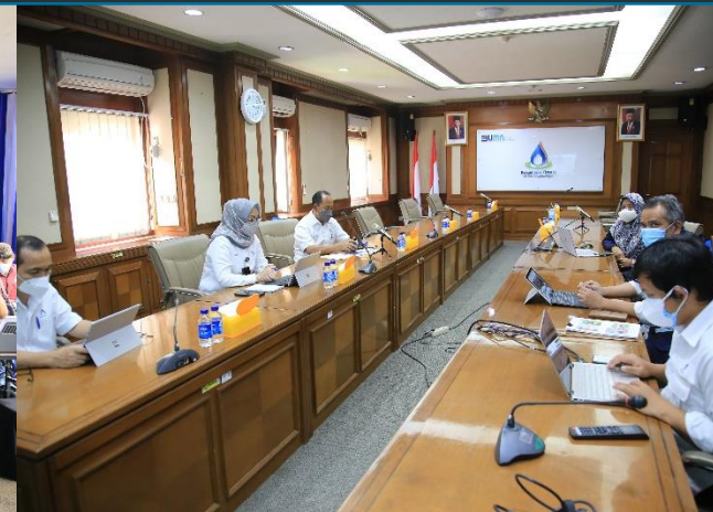
8. Penjurian BUMN Track, 24/02/2022