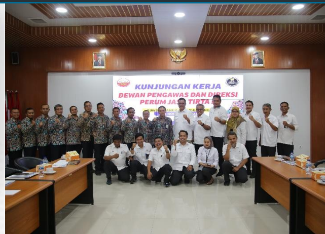
63. Kunjungan Kerja Dewas dan Direksi PJT II ke BBWS Cimanuk – Cisanggarung, 2-3/11/2022