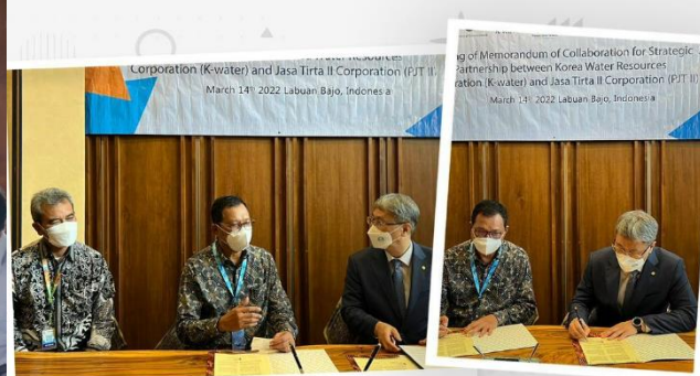
Jasa Tirta II dan K-Water Jalin Kerjasama Strategis