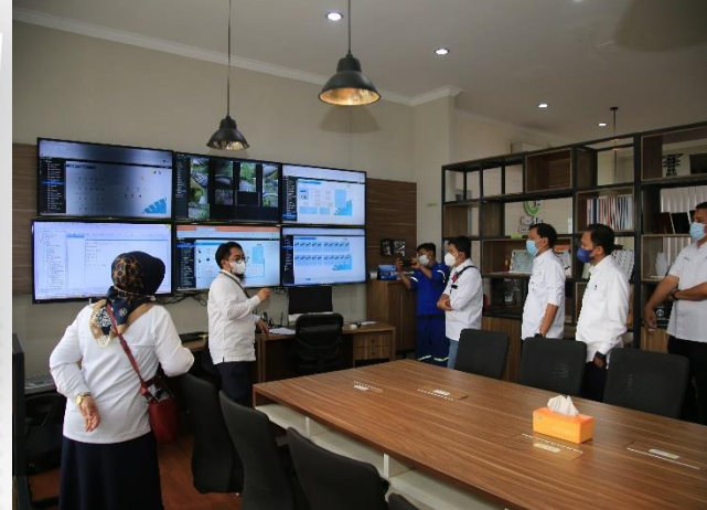
17. PJT II Hadir di World Water Forum ke-9 di Senegal, 21-26/03/2022