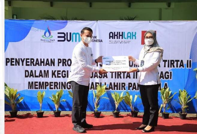
32. Program Tujuan Pembangunan Berkelanjutan, PJT II Tingkatkan Pemberdayaan Ekonomi, Sosial dan Lingkungan, 28/06/2022