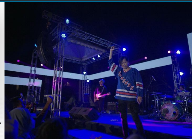
54. Acara Puncak HUT ke-55 PJT II, 26/08/2022