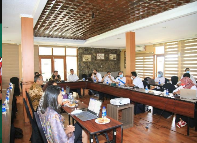
2. Kunjungan PT. Indra Karya ke PJT II, 26/01/2022