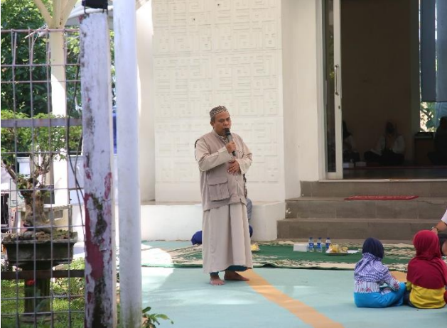
73. Memohon Perlindungan, PJT II Lakukan Tausiah dan Doa Bersama, 29/11/2022