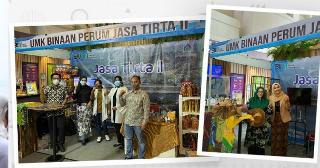
Jasa Tirta II Buka Akses Pasar Bagi UMK Binaan