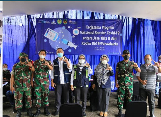
7. PJT II Gelar Vaksin Booster Bagi Karyawan dan Masyarakat, 24/02/2022