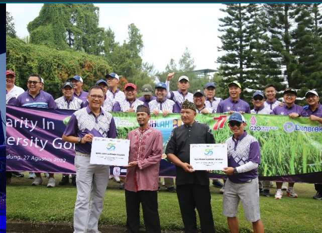
55. Charity in Diversity Golf, 27/08/2022