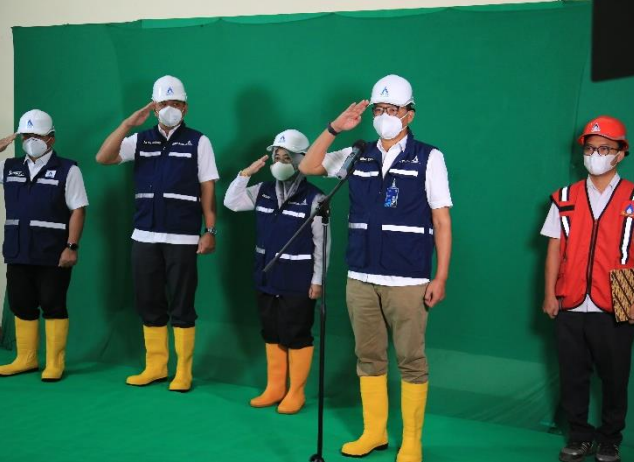
1. Apel Bulan K3 Nasional, 24/01/2022