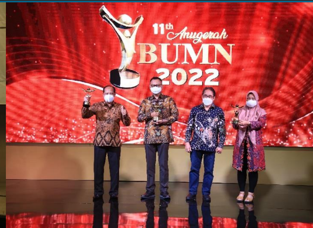
15. PJT II Raih Penghargaan Anugerah BUMN Kategori "Driving Transformation" 24/03/2022