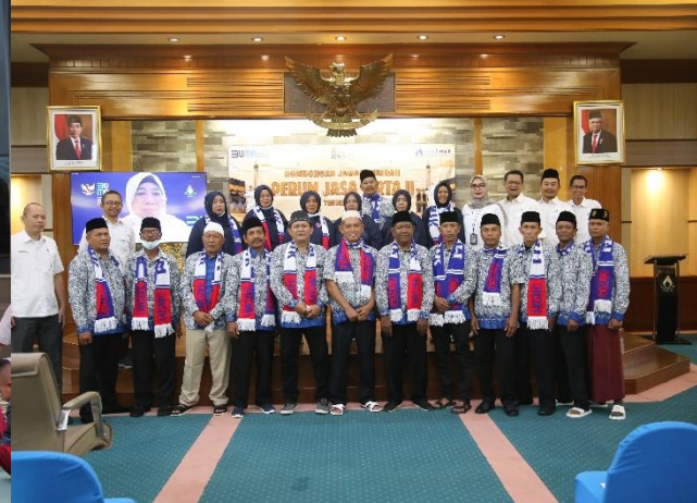
74. PJT II Berangkatkan 14 Karyawan Umrah Gratis, 30/11/2022