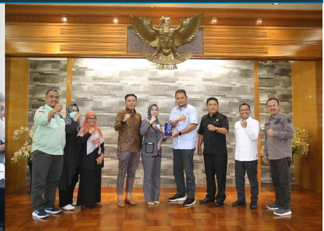
72. Kunjungan Kerja DPRD Kabupaten Karawang ke PJT II, 28/11/2022