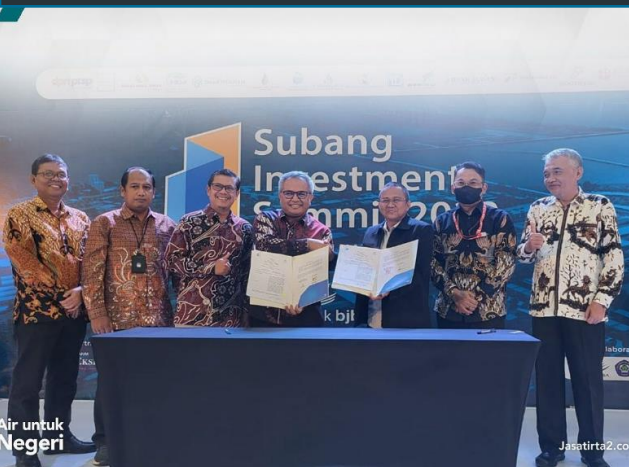
77. PJT II Lakukan MoU Pengembangan SPAM Sektor Hilir, 20/12/2022