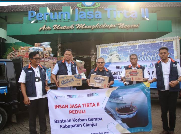
69. PJT II Bantu Korban Gempa Cianjur, 22/11/2022