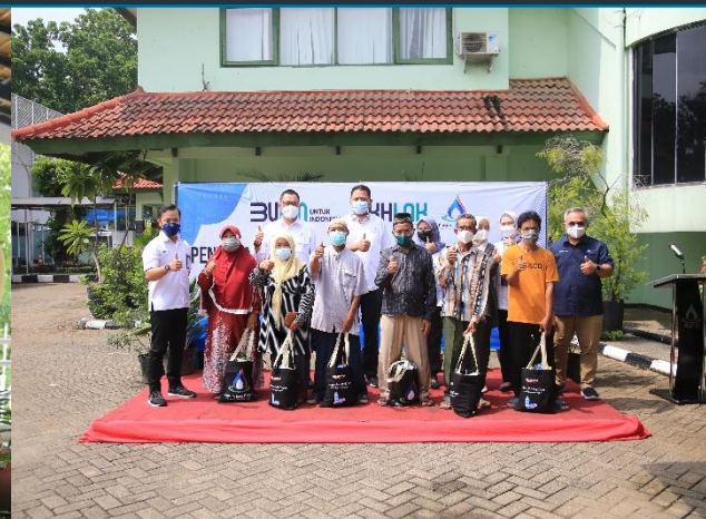
23. Sambut Idul Fitri, PJT II Bagikan 2300 Sembako, 27/04/2022