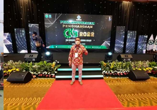
28. PJT II Sabet Tiga Penghargaan K3, 24/05/2022