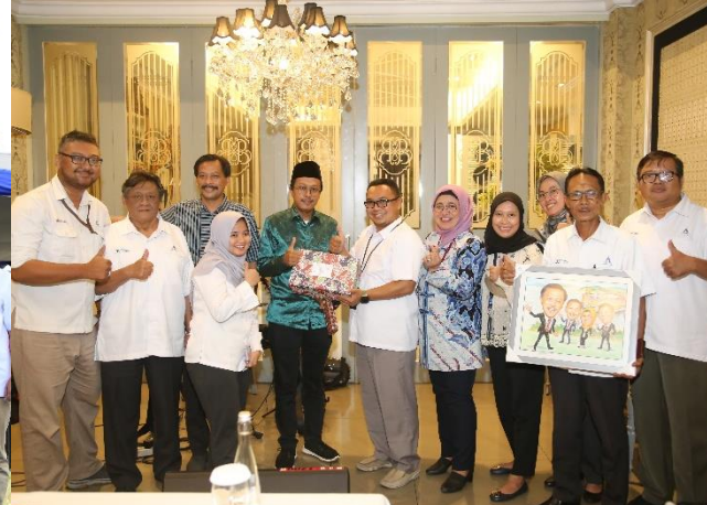
58. Pisah Sambut Dewan Pengawas PJT II, 28/09/2022