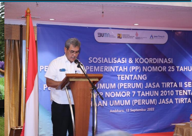
56. Sosialisasi PP No. 25 Tahun 2022 tentang Perum Jasa Tirta II, 12/09/2022