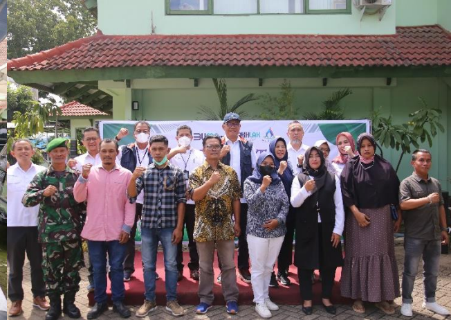
68. Dukung Hari Pohon Sedunia, PJT II Salurkan Bantuan Program TJSL, 21/11/2022