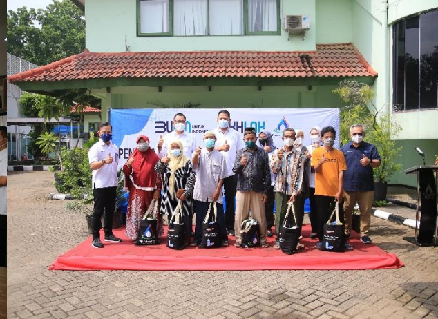
18. Kunjungan Dewas PJT II ke PJB Cirata, 28/03/2022