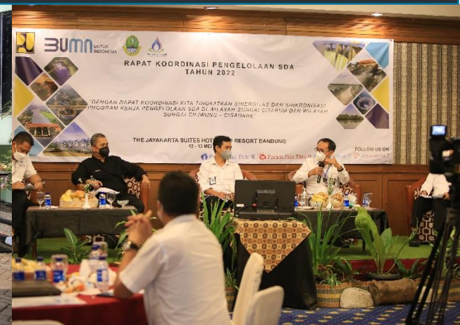
24. Rapat Koordinasi Pengelolaan SDA Tahun 2022, 12-13/05/2022