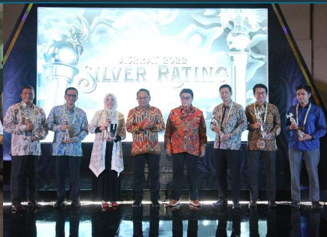
70. PJT II Raih Penghargaan Sustainability Report, 24/11/2022