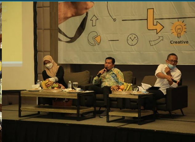
14. PJT II Gelar FGD Klasifikasi Informasi Publik, 24/03/2022