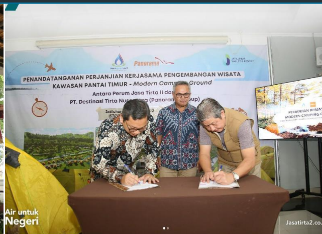
80. Penandatanganan Kerjasama Pengembangan Wisata Kawasan Pantai Timur, 26/12/2022