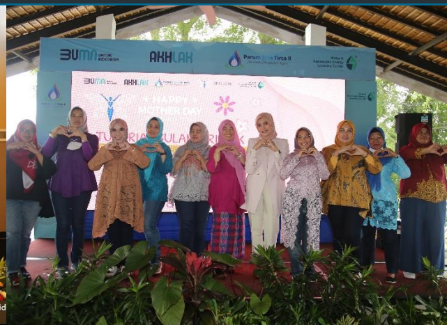
79. Kegiatan Peringatan Hari Ibu Tahun 2022 Srikandi PJT II, 23/12/2022