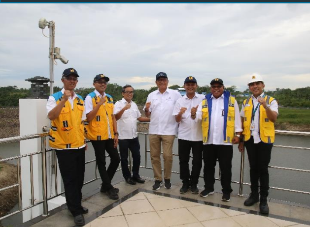
61. Kunjungan Kerja Dewas dan Direksi PJT II ke BBWS Ciujung, Cidanau dan Cidurian, 24/10/2022