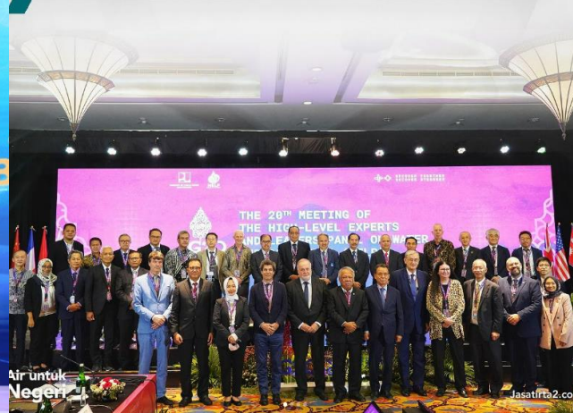
66. The 20th Meeting of The High-Level Experts and Leaders Panel of Water and Disasters (HELP), 10-11/11/2022