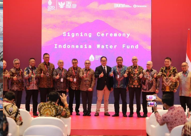
60. Penandatanganan Pembentukan Indonesia Water Fund, 17-18/10/2022