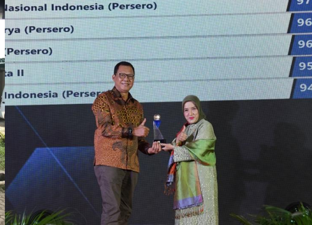
76. PJT II Raih Kategori BUMN "Informatif" pada Anugerah KIP Tahun 2022, 14/12/2022