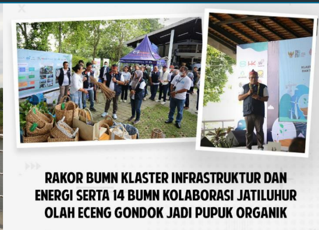
RAKOR BUMN KLASTER INFRASTRUKTUR DAN ENERGI SERTA 14 BUMN KOLABORASI JATILUHUR OLAH ECENG GONDOK JADI PUPUK ORGANIK