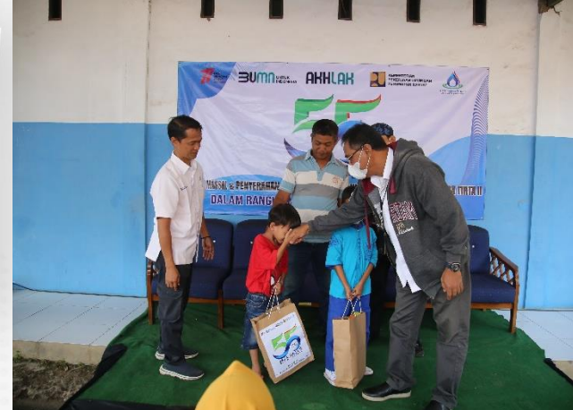
50. Sunatan Massal PJT II, 24/08/2022