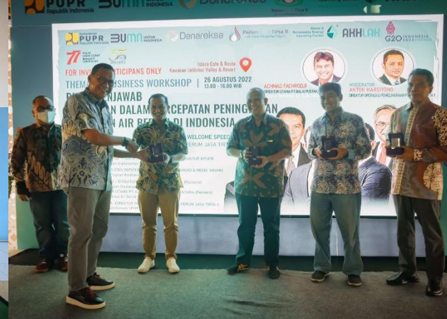
51. Workshop Thematic Business, 26/08/2022