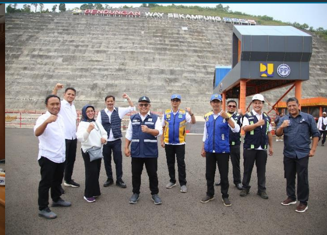
64. Kunjungan Kerja Dewas dan Direksi PJT II ke BBWS Way Seputih - Sekampung, 07/11/2022