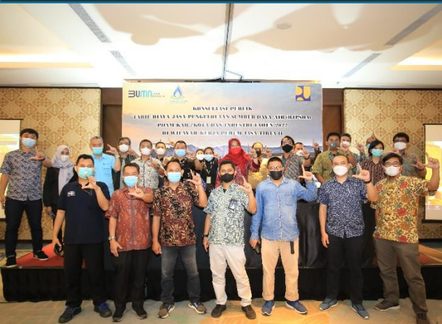
5. Konsultasi Publik BJPSDA, 11/02/2022