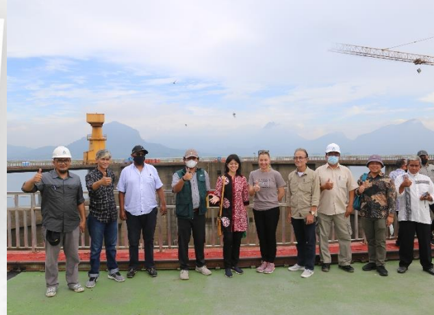
27. Kunjungan Kerja World Bank ke PJT II, 21/05/2022