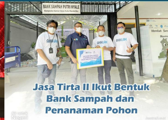
Jasa Tirta II Ikut Bentuk Bank Sampah dan Penanaman Pohon