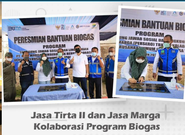
Jasa Tirta II dan Jasa Marga Kolaborasi Program Biogas